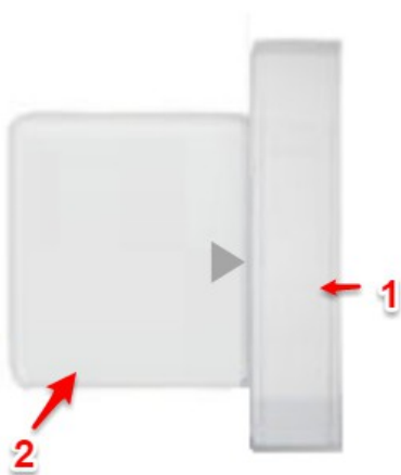
[Abbildung Sensor / Magnet]